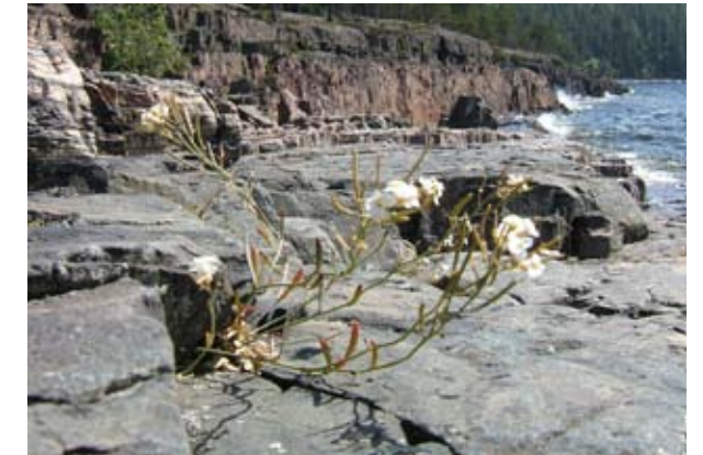
Strandtrav ( Cardaminopsis petraea )